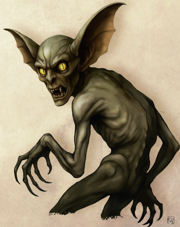
Mutant von Kristin Heldrung

Dies ist ein Hinweis darauf, dass die Kreatur einmal eine normale Person war. Die SC dürfen jedoch gerne zunächst andere Schlüsse ziehen und spekulieren.