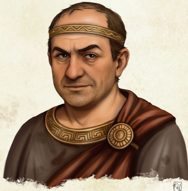
Pherodemus serr Illacriion von Kristin Heldrung

Pherodemus hat vor sieben Tagen eine Feier in der Stadtvilla begonnen, ist aber von dort geflohen, als die Quarantäne ausgerufen wurde. Die Gäste und seine Bediensteten hat er dort zurückgelassen, was er nun bereut. Die Feier läuft seines Wissens seitdem weiter, da niemand Zentropolis verlassen darf und die Gäste es offenbar vorziehen, die Quarantäne in der Villa auszusitzen.