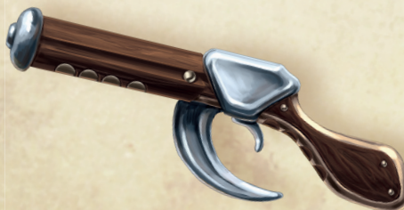
Faustbela von Katrin Wittig