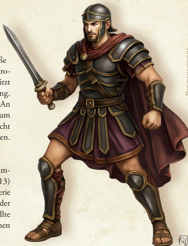
Imperiale Wache von Kristin Heldrung

Alle Charaktere, die sich in der Nähe der Wachen herumtreiben, müssen einen GES (Heimlichkeit)-Wurf (SG 13) ablegen. Bei einem Erfolg kann der SC unbemerkt die Szenerie beobachten, bei Misslingen läuft er/sie in die Wachen an der Sicherheitsbarriere hinein und wird verwarnt. Den SC sollte rasch klar werden, dass es nahezu unmöglich ist, ungesehen über die Brücken ans Ziel zu gelangen.